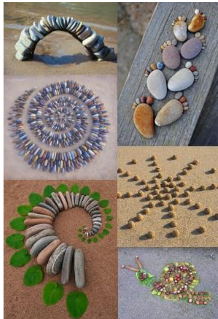
Exemples de Land'Art

" J'utilise tout d'abord seulement les feuilles que le vent a fait tomber, je compte sur le vent et le gel pour me procurer mes matériaux " Andy Goldsworthy.