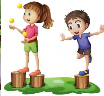
La Compagnie Kif Kif et les enfants de Bluffy en apprentissage de jonglage.